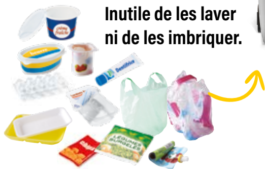
Emballages en plastique

Bien les vider Inutile de les laver ni de les imbriquer.