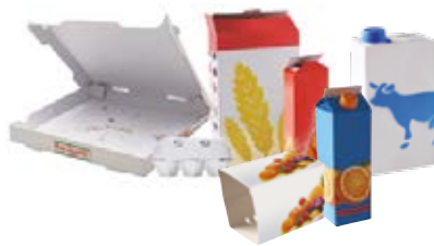
Emballages et briques en carton