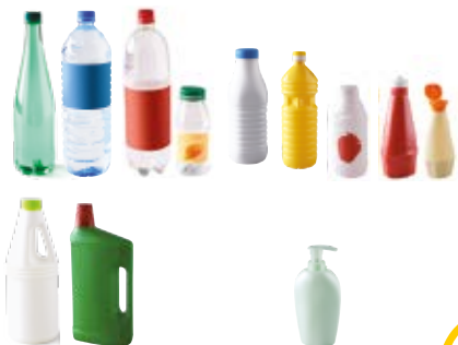
Bouteilles et flacons en plastiques

Les emballages triés doivent être DÉPOSÉS EN VRAC dans le bac à couvercle jaune, pas de sacs opaques.